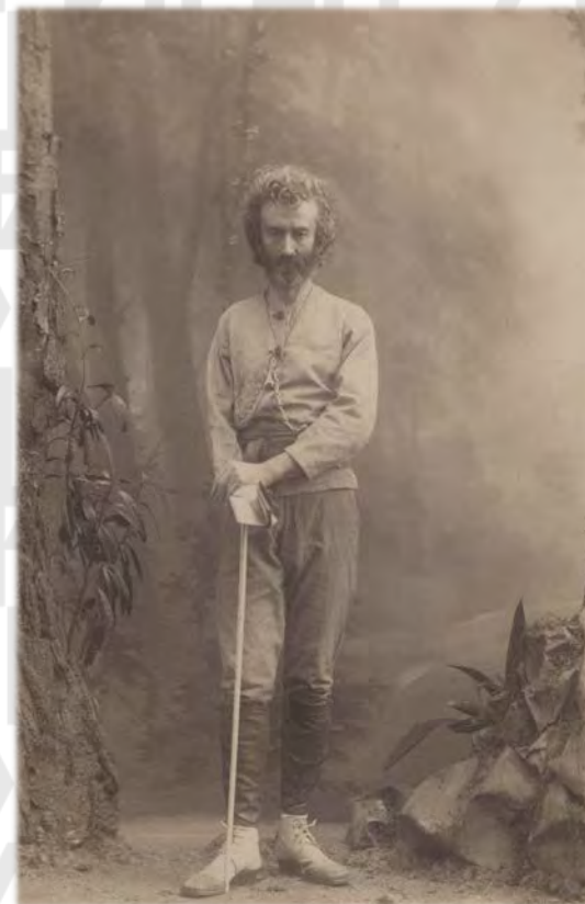
Николай Николаевич Миклухо-Маклай (1846-1888).

Основан на материалах легендарных экспедиций на о-в Новая Гвинея XIX в., а также современных исследований региона Южных морей (конец XX – начало XXI вв.)