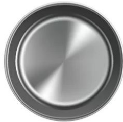
Форма для запекания