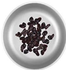
Изюм — 60 г