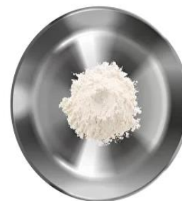
Разрыхлитель — 10 г