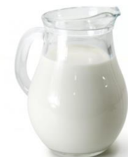
Молоко – 200 мл