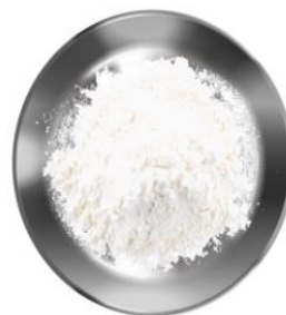
Мука — 210 г