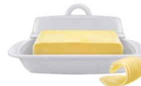
Сливочное масло — 10 г