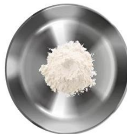
Разрыхлитель — 10 г