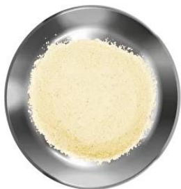
Манная крупа — 40 г