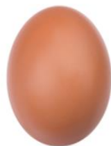
Яйцо — 1 шт.