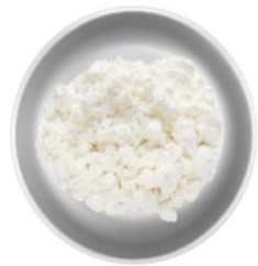
Творог — 500 г