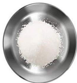
Сахар — 30 г