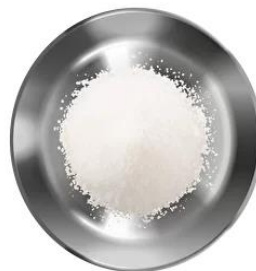
Сахар — 70 г